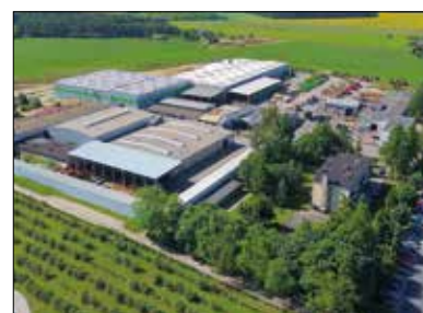
Polský závod firmy Strautmann

silážní lopaty nebo vykusovače siláže. Coby výrobce zemědělských strojů s širokým polem působnosti - krmné vozy, sběrací vozy, univerzální rozmetadla a přepravní technika i technika pro dávkování do zařízení na výrobu bioplynu - je firma Strautmann kompetentním partnerem téměř pro každého zákazníka působícího v těchto průmyslových odvětvích.