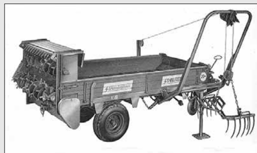
Streublitz s bočním nakladačem z r. 1957

60letých zkušeností s výrobou rozmetadel využila firma Strautmann k dalšímu zdokonalení rozmetadla „Streublitz“ a ještě více jej přiblížila požadavkům svých zákazníků. Využijte těchto zkušeností i Vy! Firma Strautmann udává krok v oblasti stability, dlouhé životnosti a flexibility. Možnost vysokého zatížení a dlouhá životnost jsou nejdůležitějšími faktory, kterými se vyznačuje dobré rozmetadlo.