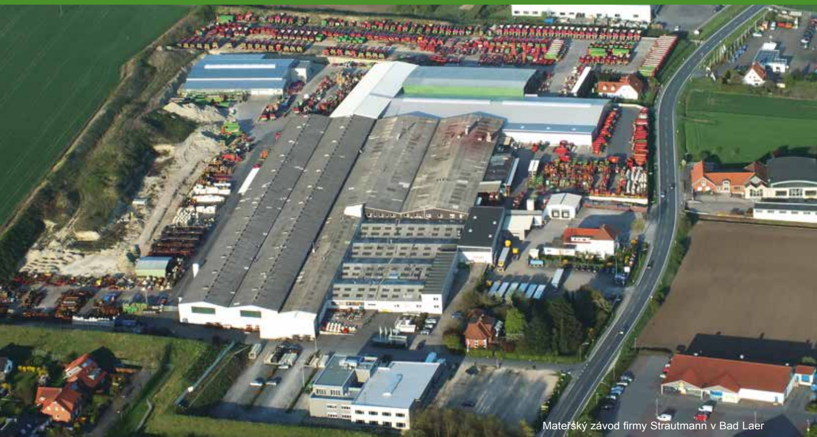
Mateřský závod firmy Strautmann v Bad Laer

Podnik B. Strautmann & Söhne GmbH u. Co. KG je středně velký Rodinný podnik v jižním Dolním Sasku. V současné době je v jeho čele již třetí generace majitelů, kteří jej před 80 roky založili. Ve druhém, moderně zařízeném výrobním závodu ve Lwówku (Polsko) vyrábí společnost Strautmann vedle jednotlivých strojních komponent i součásti svého výrobního programu, do něhož patří sklápěcí přívěsy, vybírací