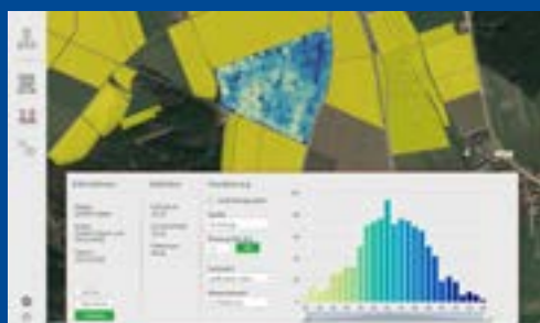
Mapa indexu dusíku