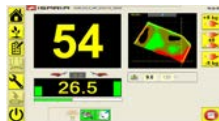
REŽIM OZIMÁ PŠENICE