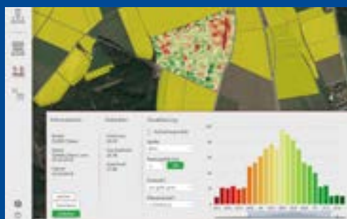
Mapa indexu biomasy

Senzor zachycuje data vztahující se k aktuálnímu zdravotnímu stavu rostlin, růstové fázi a potřebám dusíku skenovaných rostlin.