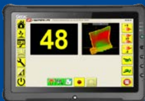
Ovládací terminál CropXplorer